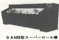
SA500型スーパーロール機