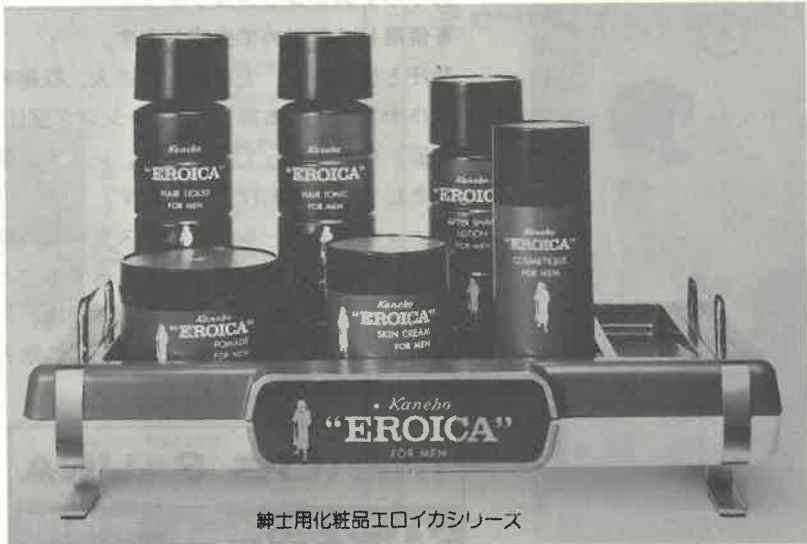
紳士用化粧品エロイカシリーズ

エロイカのあの独特の清涼感とまろやかさ、心にゆとりを生む気品ある香り。英雄は英雄を知るとか。エロイカは、おだくのサウナに一級のお客さまを呼ぶてしよう。